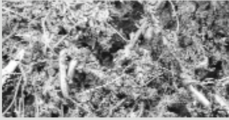
Miam-miam les vers de terre